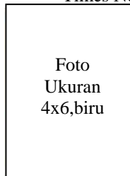
Foto Ukuran 4x6, biru