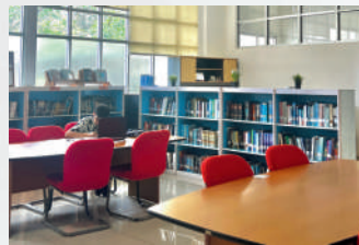
Ruang Belajar Perpustakaan