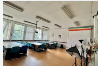
Lab Digital Media